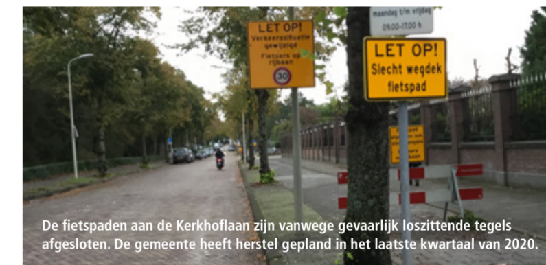
De fietspaden aan de Kerkhoflaan zijn vanwege gevaarlijk loszittende tegels afgesloten. De gemeente heeft herstel gepland in het laatste kwartaal van 2020.