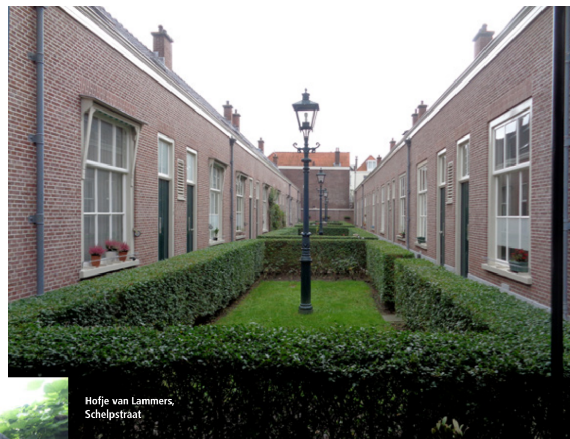
Hofje van Lammers, Schelpstraat

'Wie geeft de bewoners ongelijk dat zij de rust van hun oase in het stadsrumoer willen beschermen'