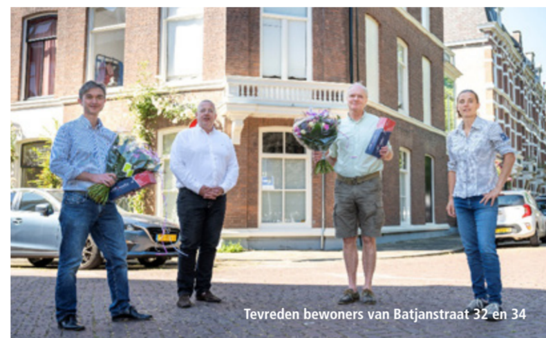
Tevrede bewoners van Batjanstraat 32 en 34