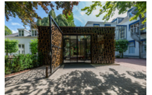
P.5 Museum Sophiahof