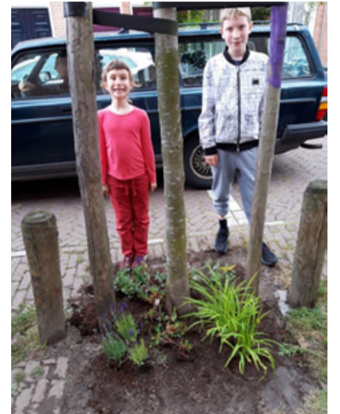
P.6 Boomspiegeltuintjes Malakkastraat