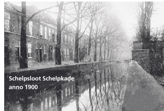
Schelpslot Schelpkade anno 1900

Er werden inderdaad schelpen vanaf het Scheveningse strand over vervoerd. Die schelpen waren nodig voor de Haagse huizenbouw en de aanleg van paden. Na 1903 werd dit stuk van de zijtak gedempt en verdween ook de kade.