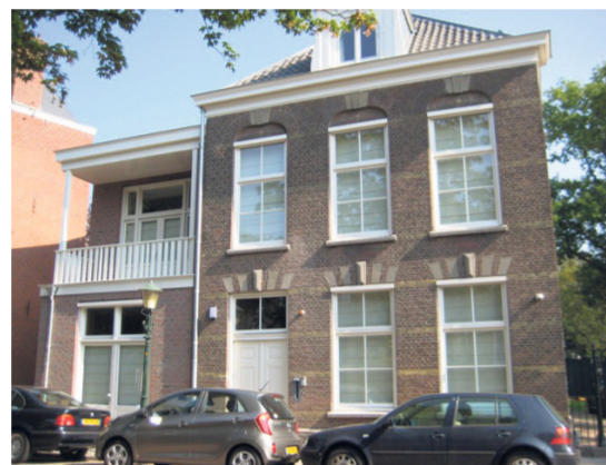
Boven Gerenoveerde villa aan de Schelpkade Onder Voorgevel compleet met onlangs geplaatst balkonhekwerk