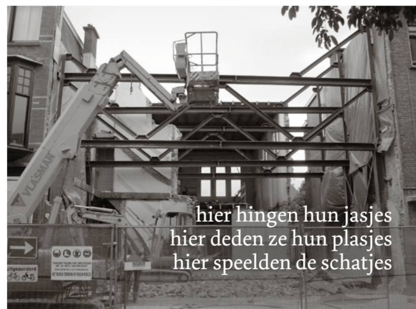
hier hingen hun jasjes hier deden ze hun plasjes hier speelden de schatjes