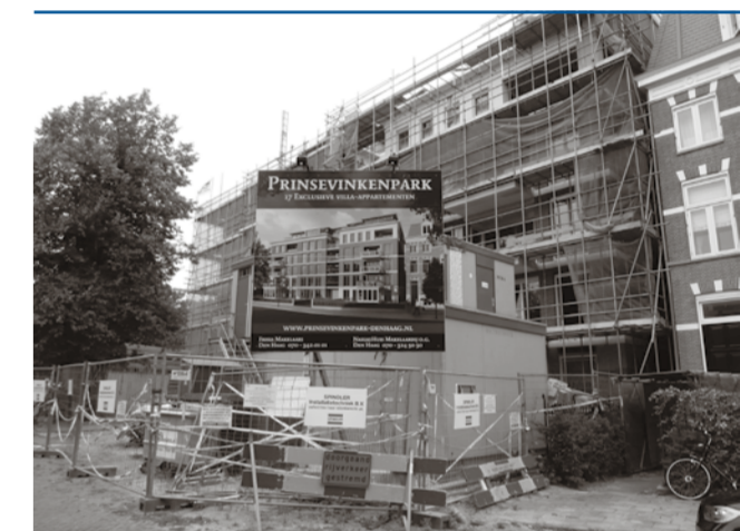
De werkzaamheden aan het Prinsevinkepark zijn weer hervat. Er is een nieuwe aannemer (van Omme&deGroot), die blijkbaar alle retentierchouders tevreden heeft weten te stellen.