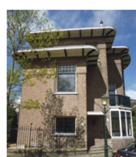
Villa Nieuw Parkwijk

van de boven elkaar gelegen eetkamer en de salon is af te lezen in de vorm van een halfronde erker in de gevel. De enige versieringen zijn de horizontale en verticale raamdetailleringen. Haagse plannen Berlage bouwde in Amsterdam (Beurs van Berlage en het Plan Zuid), maar ook veel in Den Haag en drukte met het Plan Berlage een belangrijk stempel op de stad en de planmatige uitbreidingen. De gemeenten werden hiertoe verplicht op grond van de Woningwet van 1901. In dat plan ontwierp Berlage de doorbraken van Hofweg, Torenstraat, Vondelstraat en Jurriaan Kokstraat. Zijn ontwerp voor het Vredespaleis werd niet bekroond. Bijzonder aan het plan Berlage voor Den Haag was de Interna-