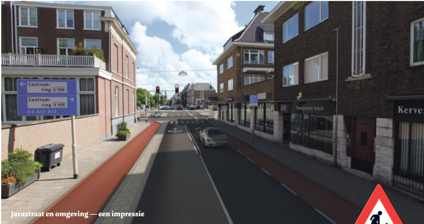
Javastraat en omgeving — een impressie