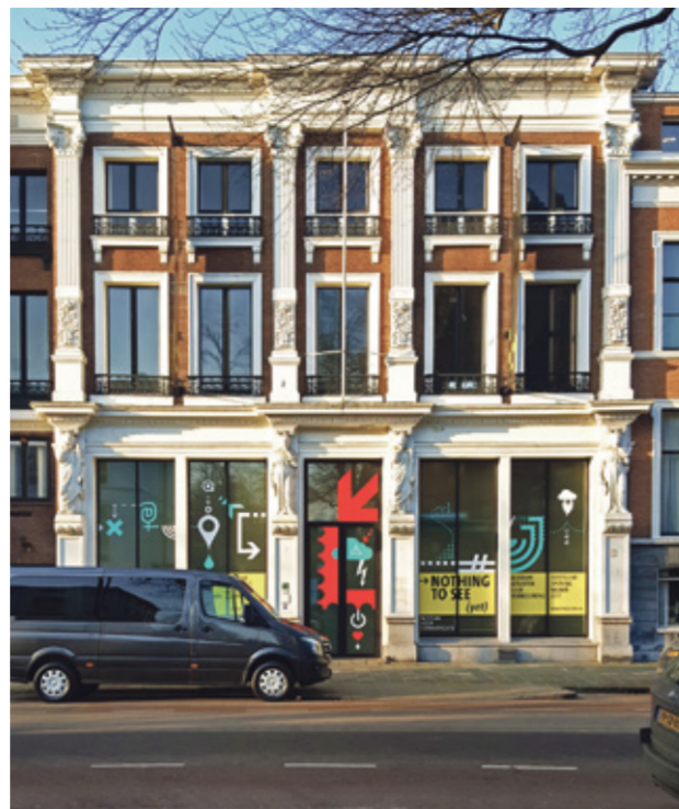
Communicatiemuseum in pand Bazar

Communicatiemuseum COMM In het weekend van 3, 4 en 5 november heropende het vernieuwde Communicatiemuseum COMM haar deuren, dat zich nu veel meer richt dan voorheen op de nieuwste communicatietechnieken. Bij de huidige verbouw is gekozen voor een begane grond volgens het principe van het warenhuis, in navolging van het concept van de oorspronkelijke bazaar, met vele functies zoals ontmoetingsplek, als een vrij toegankelijke lounge met gratis WiFi, waar de bezoeker alvast een blik wordt gegund op een deel van de collectie en een winkel, nog voordat zij of hij het museum zelf binnentreedt.