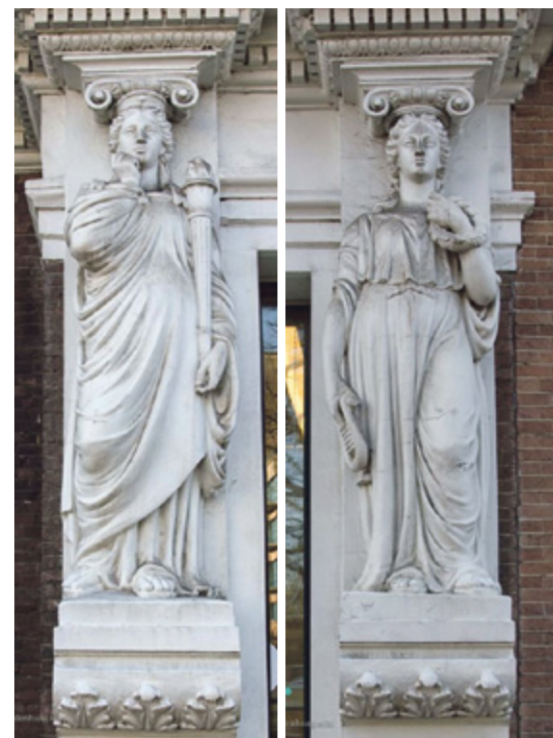
Kariatiden in de gevel van de Bazar met renaissance- en classicistische elementen

Graag leid ik u rond langs de in deze serie artikelen beschreven gebouwen in de Archipel & Willemspark. contact: bartelebrouwer@gmail.com