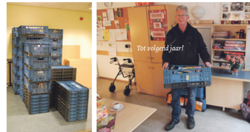
Tot volgend jaar!

Al met al weer een geslaagde actie. Dank aan alle mensen die op enigerlei wijze hebben bijgedragen om de actie weer te doen slagen. Mocht U niet in de gelegenheid zijn geweest om voedsel te doneren maar toch een bijdrage wilt geven, kunt u ook geld overmaken t.n.v. St. Voedselbank Haaglanden, NL 83 INGB 0004 2158 92.