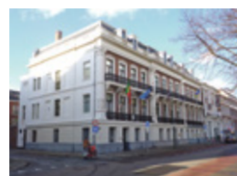
Gevel van de voormalige 'Groote Koninklijke Bazar' van 1879 met gedecoreerde witgepleisterde lijstgevel met gietijzeren sierhekken op de Belétage