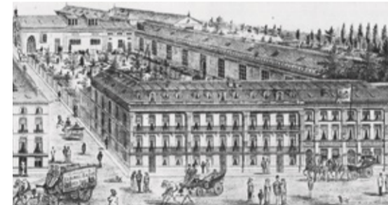
Plantenkassen, wandelhof en promenade achter de Bazar Royal