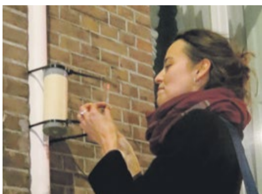
Op de Javastraat wordt de kwaliteit van de lucht gemeten