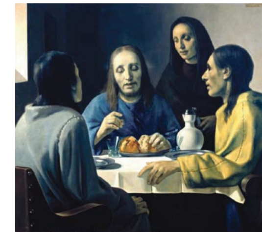
De Emmaüsangers van Han van Meegeren

geld hadden uitgegeven aan een valse Vermeer en dus in de val waren gelopen, en die hun twijfels liever niet lieten blijken. Want ja, dan nam je je verlies. In dat illustere rijtje van mensen staan Göring en de directeurs van Boymans van Beuningen en van het Rijksmuseum.