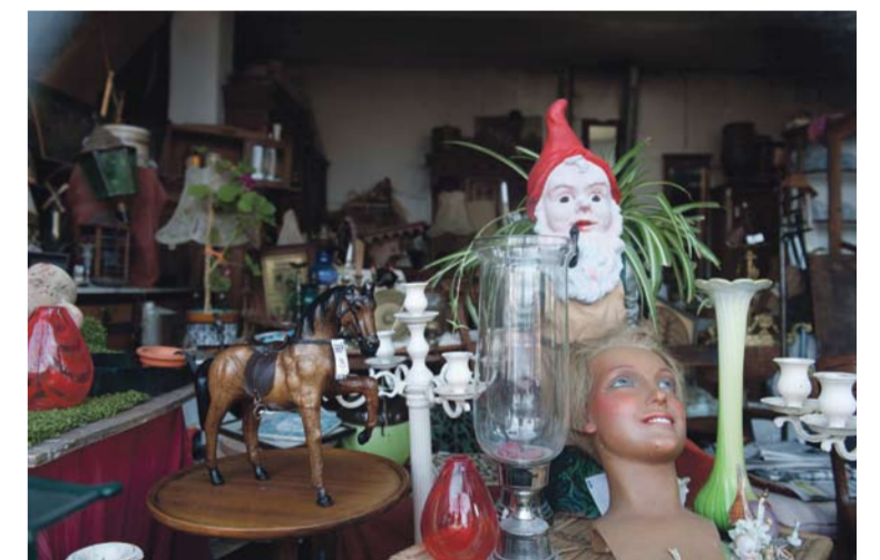
Fotobijchriften van boven naar beneden

[1] Ik ben op veel plaatsen geweest, nooit trof ik zo'n perspectief. Zou het komen doordat Nederland zo plat is? Gebouwen lijken hier vaak op een groot schip. Op de foto is goed te zien wat ik bedoel. AH is een ontmoetingsplaats. Op de stoep ervoor en in de winkel staan altijd mensen met elkaar te praten.