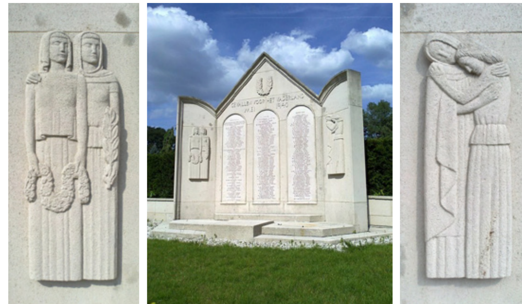
Militaire Erehof op de Openbare Begraafplaats Den Haag, Kerkhoflaan.

“Het komt soms voor dat nabestaanden een graf van een oorlogsslachtoffer laten ruimen en dat er in overleg met ons een waardige plek op een ereveld wordt gevonden. Lang niet alle graven van oorlogsslachtoffers worden overigens door ons onderhouden, een groot aantal betreft particuliere (familie-) graven. Wij richten ons op Nederlanders – soms verzetsstrijders – die door hun betrokkenheid bij oorlogshandelingen om het leven gekomen zijn. Dat betreft voornamelijk slachtoffers uit de Tweede Wereldoorlog. Daarnaast zijn we betrokken bij slachtoffers uit voormalig Nederlands-Indië en vredesoperaties.’