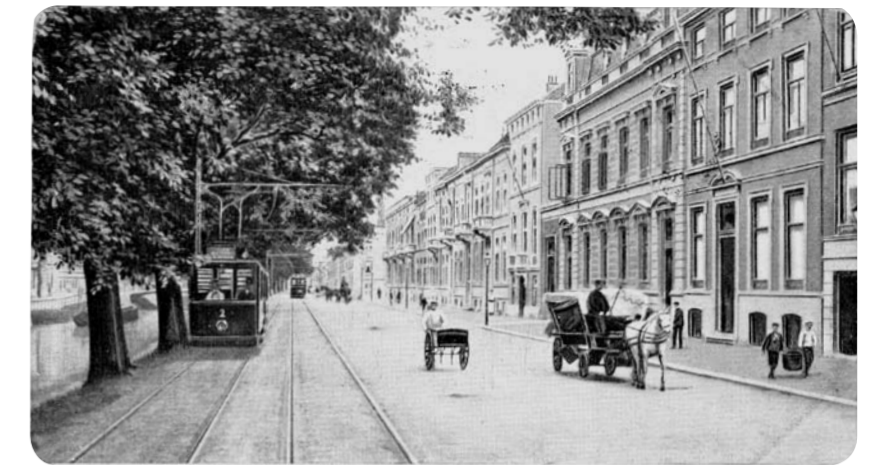
Koninginnegracht ca 1900

Er staan in verschillende bladen berichten over de voorgenomen veranderingen ten aanzien van tramlijn 9. Het is interessant om deze veranderingen nader te bekijken. Vrij onverwacht kwam het bericht dat men de baan van lijn 9 langs de Koninginnegracht bij de drukke kruisingen met het wegverkeer verdiept wil aanleggen. Dit is bij de Dr. Kuyperstraat, Javastraat en Laan Copes van Cattenburch. Indien men alleen bij deze kruisingen een verdiept spoor wil aanleggen en verder gewoon bovengronds blijft dan wordt de trambaan een soort Cake Walk. Wil men tussen de genoemde kruispunten de hele baan verdiept aanleggen dan zal die van af de Dierentuinbrug naar beneden moeten en in de buurt van Sumatrastraat pas weer bovenkomen. De vraag die bij verdiepte aanleg naar voren komt is, hoe gaat het met de haltes, komen die ook verdiept met trappen en liften en is daar ruimte (en geld) voor? Of worden de haltes verplaatst naar het bovengrondse deel en komen ze dan op onlogische plaatsen? Ook is de vraag hoe wordt het geheel ingepast in het Rijksbeschermd stadsgezicht ter plaatse. Ook was er een suggestie om de lijn te verplaatsen naar de Raamweg. Hij zou dan niet alleen verdiept maar geheel ondergronds gebracht moeten worden. Nog afgezien van de kosten, hierbij zou deze al zwaar belaste verkeersweg jaren lang deels moeten worden afgesloten voor de aanleg; een vrijwel onhaalbaar iets.