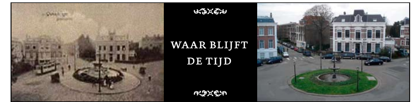
>> Het Bankaplein rond 1906, gezien vanuit de Riouwstraat richting Timorstraat. Startpunt voor de tramlijnen 1 en 2. Ze hadden elk als eindpunt station Hollands Spoor, zij het via verschillende trajecten. Lijn 1 stond bekend als de 'chique' lijn, vooral in tel bij referendarissen en andere deftige heren. Lijn 2 was meer voor de mensen met de gewone baantjes. Een jan-met-de-pet die het waagde op lijn 1 te stappen werd met scheve ogen aangekeken. Bankaplein anno nu <<